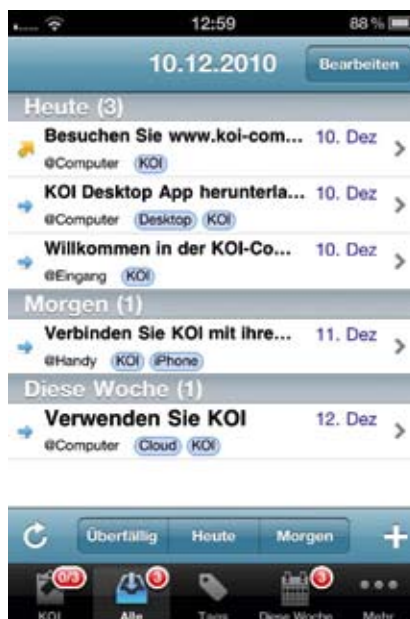
VERSCHMELZUNG VON ARBEIT UND FREIZEIT. Universelles System für die Selbstorganisation.